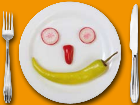
Bildung, die schmeckt! Klasse, Herzogenrath.